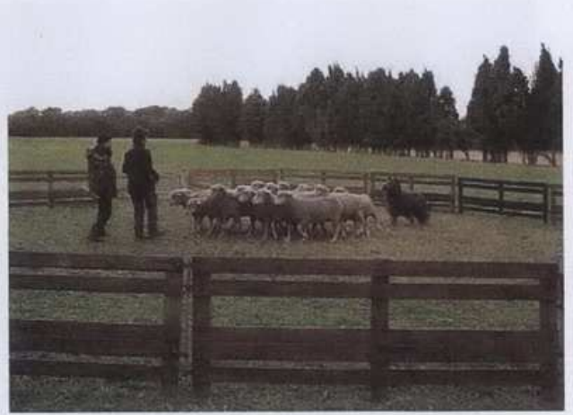
Umberto au travail au cercle. Le plus expérimenté de la troupe