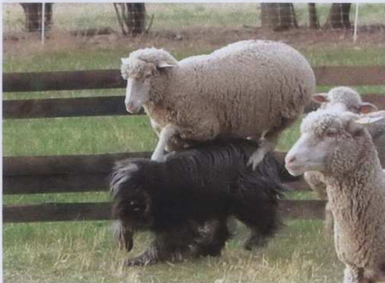
Astuce, elle , s'est fait des copines. Elles ont joué à saute mouton ou à saute briards on ne sait plus trop. Un coup toi , un coup moi !!!!!

« Ce stage fut une réelle épreuve pour Volga et Astuce car il a fallu canaliser l'excitation due à la proximité des brebis.