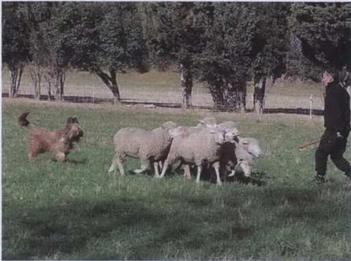
Volga en conduite . midi – 6h acquis